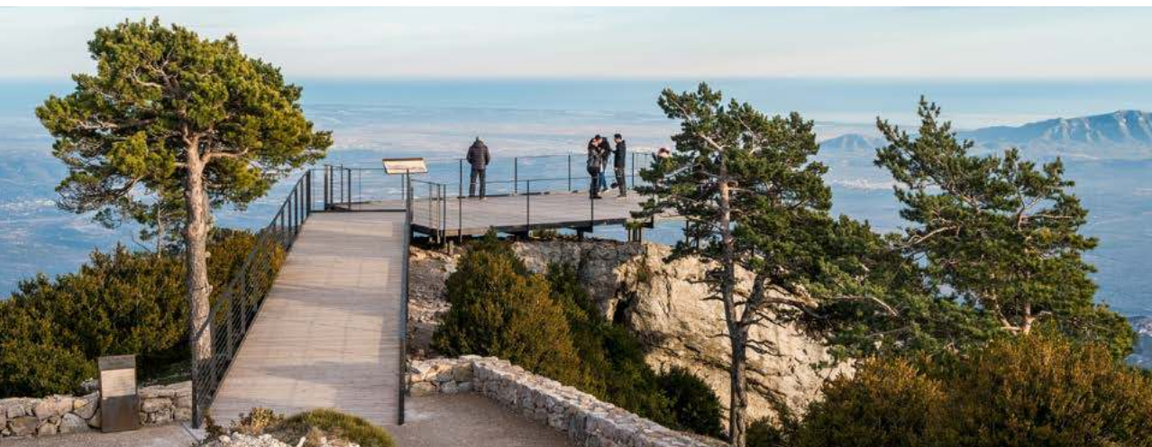
Mirador de Caro.

L'itinerari puja des del Mascar cap al coll dels Pallers entre pinedes de pi roig i pinassa, ressegueix la carena, per una zona de forts vents i vegetació escassa, fins que arriba al cim de Caro. El mirador ofereix una àmplia perspectiva de la plana de l'Ebre fins al Delta i les valls interiors dels Ports. Els voltors i altres rapinyaires sobrevolen la zona i, a les pinedes de pi roig, es pot veure amb certa facilitat el trencapinyes. La baixada coincideix parcialment amb l'antic camí de Caro, avui un sender pedregós i empinat que s'entrellaça amb la carretera asfaltada que puja al cim.